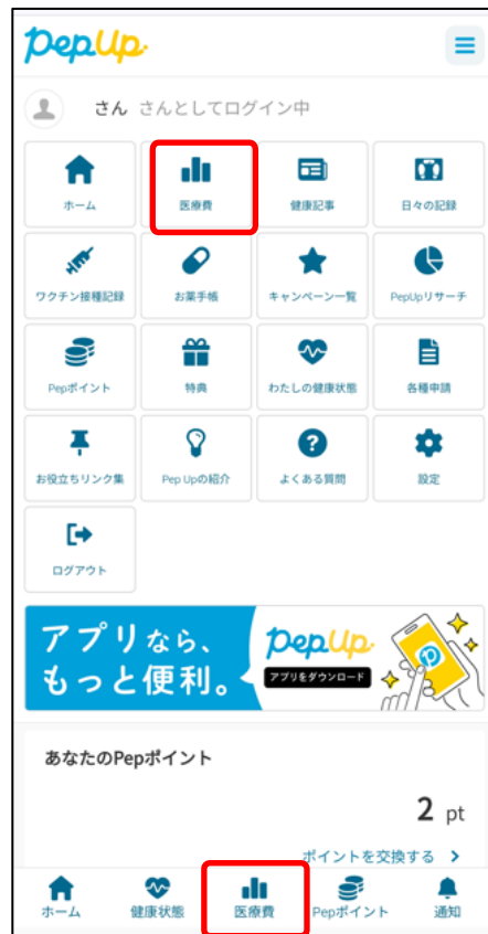
ホーム画面 （スマートフォンブラウザ）